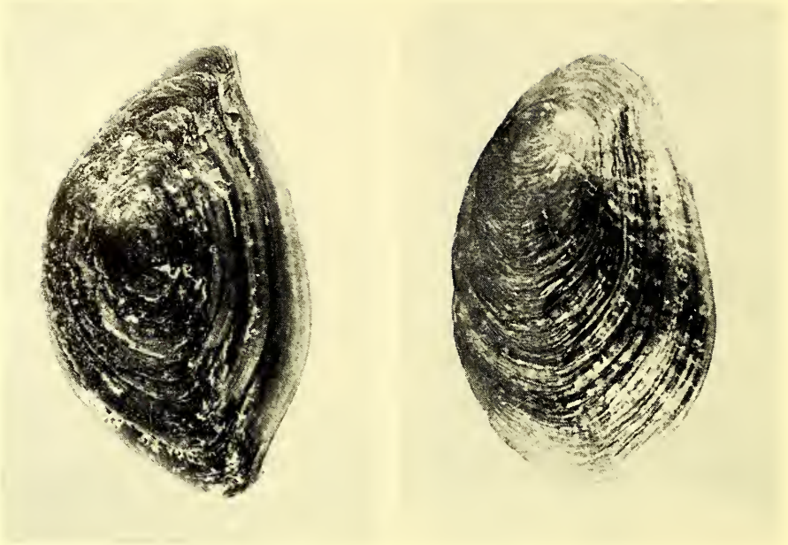
Abb. 3: Tutuſa rubeta , Operculum